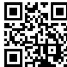
QR-code bedrijfsfilm Rottinghuis

Rottinghuis' Aannemingsbedrijf bv uit Groningen zal uw woning gaan bouwen. Rottinghuis behoort tot de grotere bouwbedrijven in het noorden en is actief in de sectoren woningbouw, utiliteitsbouw, woningverbetering en bouwservice en onderhoud. We bouwen in eigen beheer, voor derden en voor zusterbedrijven binnen VolkerWessels.